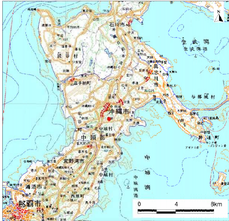
( 1/200,000 )