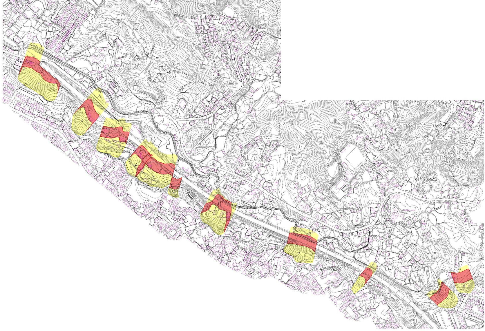
土砂災害警戒区域等の指定の公示に係る図面（その2）