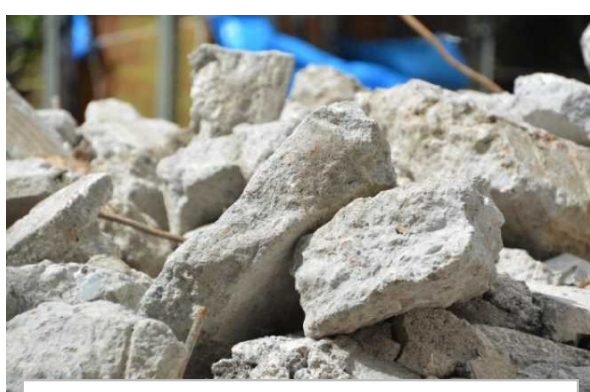
6 コンクリート (20cm前後 ※イメージ)