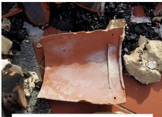
1 瓦 (大・平) (30cm程度)