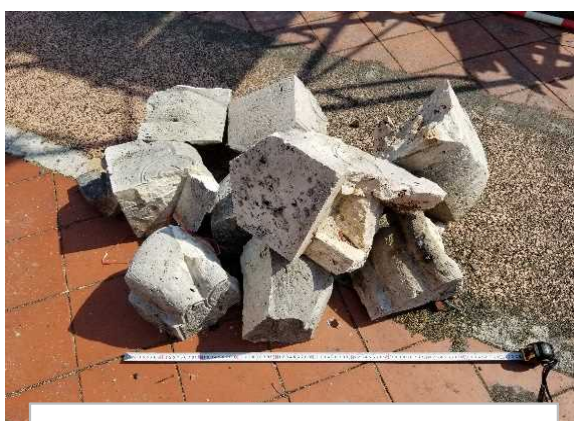
5 石材 (30cm前後)