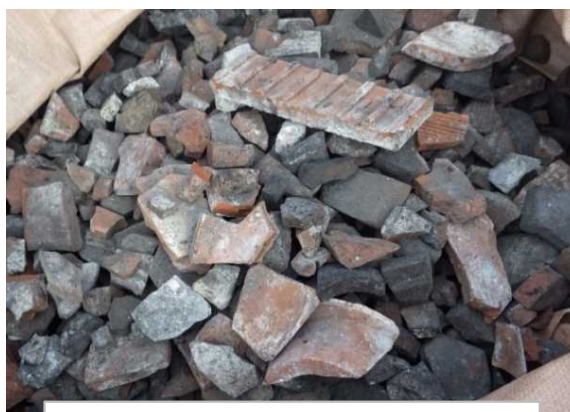
4 瓦 (小) (5cm前後)