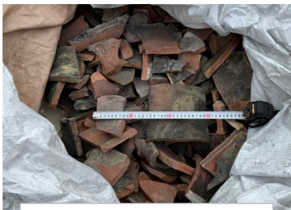
3 瓦 (中) (15cm前後)