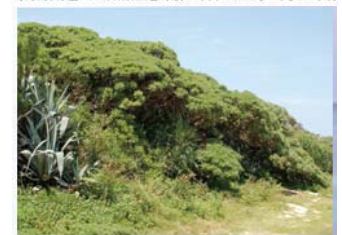
Ⓕ 照喜名原のモンバの木群落 (村指定・天然記念物/昭和59年9月14日)