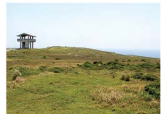
Ⓐ 番屋原の広場景勝地 (村指定・文勝/昭和59年9月14日)