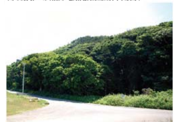
Ⓓ 字西の御願の植物群落 (県指定・天然記念物/昭和55年4月30日)