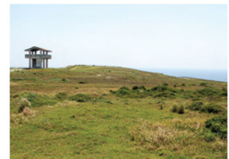
▲ 番屋原の広場景勝地 (村指定・名勝/昭和59年9月14日)