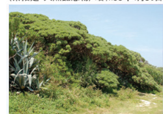
◎ 照喜名原のモンパの木群落 (村指定・天然記念物/昭和59年9月14日)