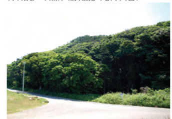
◎ 字西の御願の植物群落 (県指定・天然記念物/昭和55年4月30日)