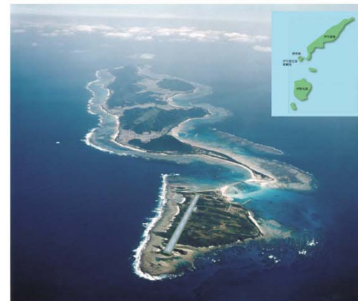
-野南島空港イメージ図- 計画をイメージしたもので、確定された建設予定図ではありません。