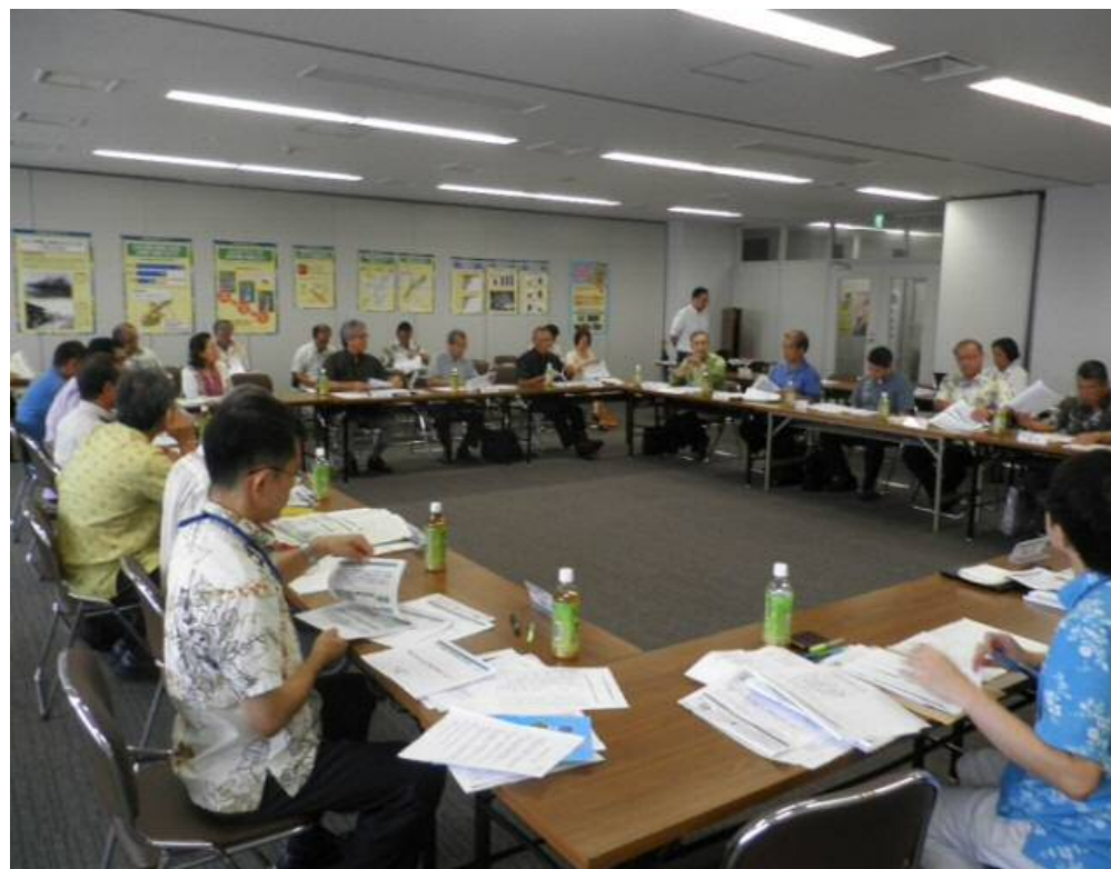
写真：平成27年5月28日 沖縄県南部合同庁舎