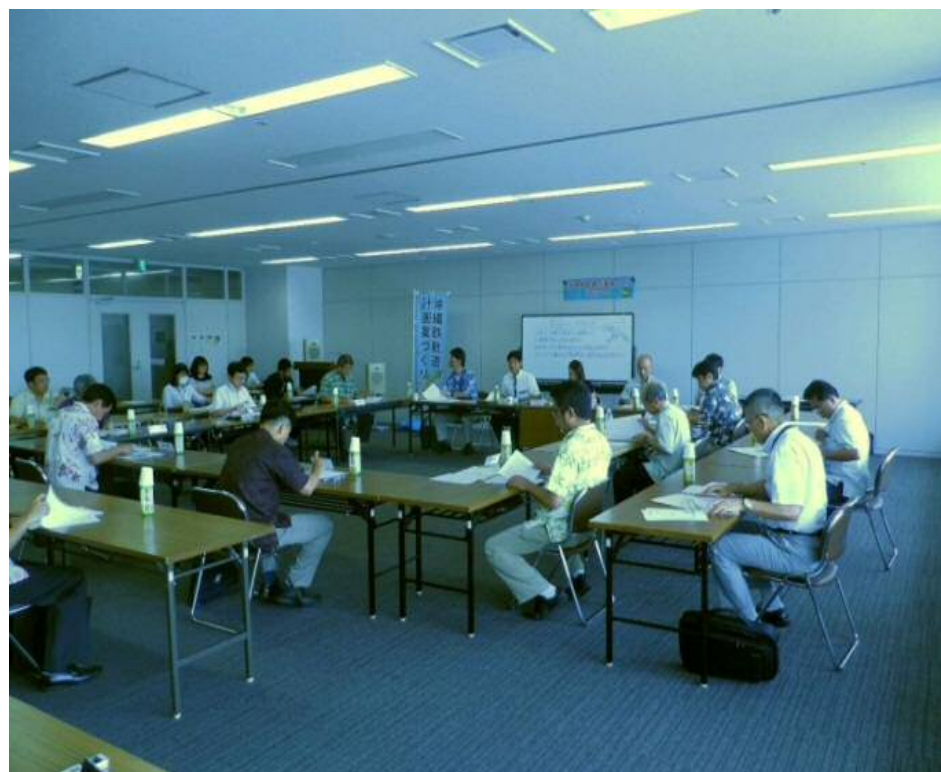
写真：平成27年5月25日 沖縄県南部合同庁舎