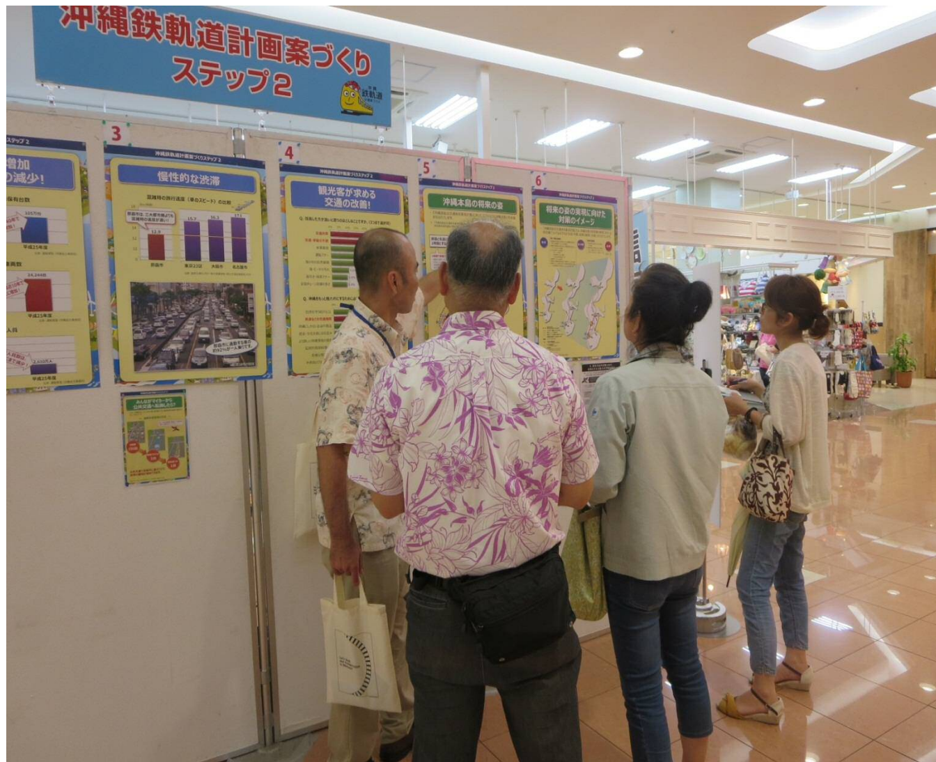
写真：平成27年5月20日 サンエー経塚シティ