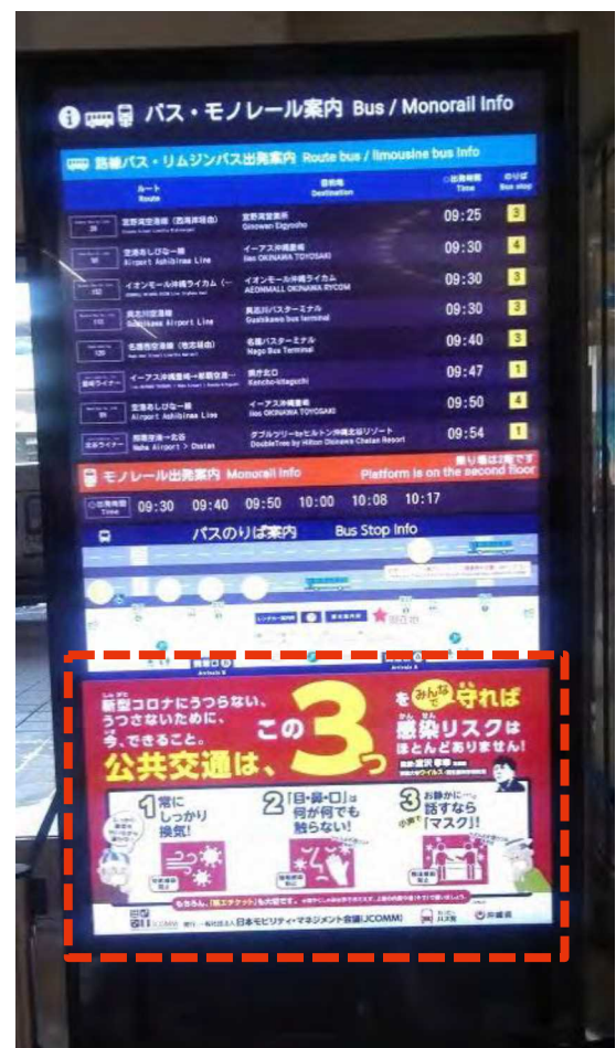
図表 66 投影の様子