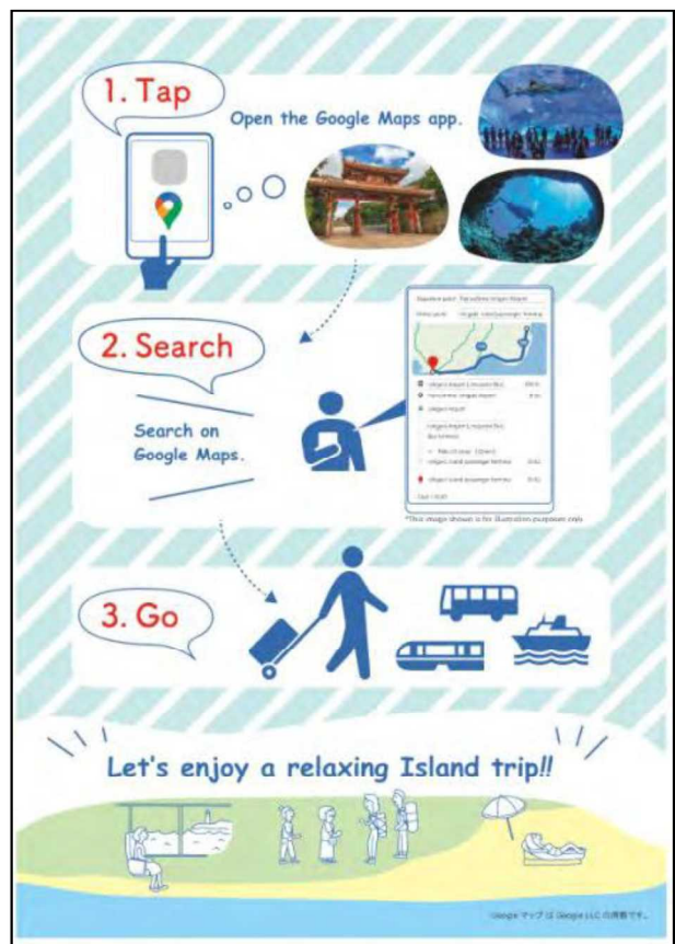
図表 59 配布したリーフレット