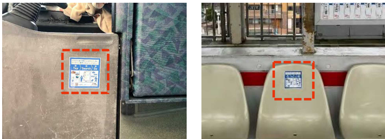
図表 63 シール設置の様子