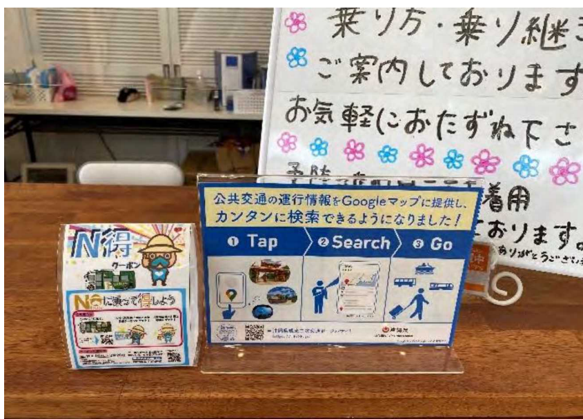
図表 64 パネル設置の様子 (南城市公共交通案内所)