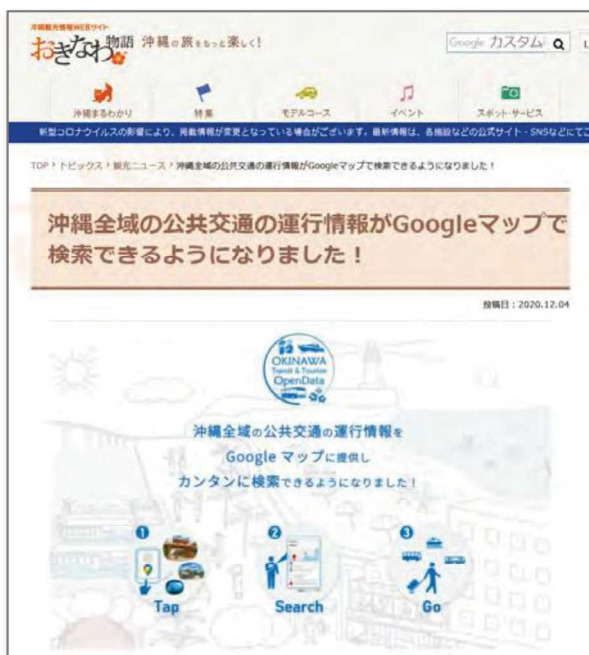
図表 67 おきなわ物語への掲載

空手ツーリズムのモデルコースを紹介する記事の中で、Google マップにより公共交通による目的地までの経路検索が簡単にできること、那覇空港のデジタルサイネージで運行情報等を確認できることが紹介された。