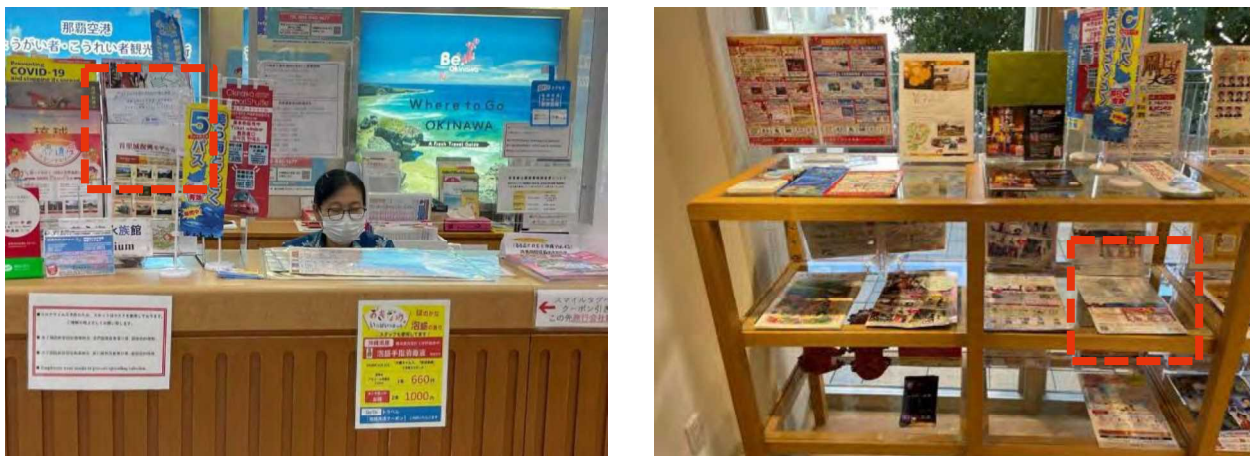
図表 62 リーフレット設置の様子