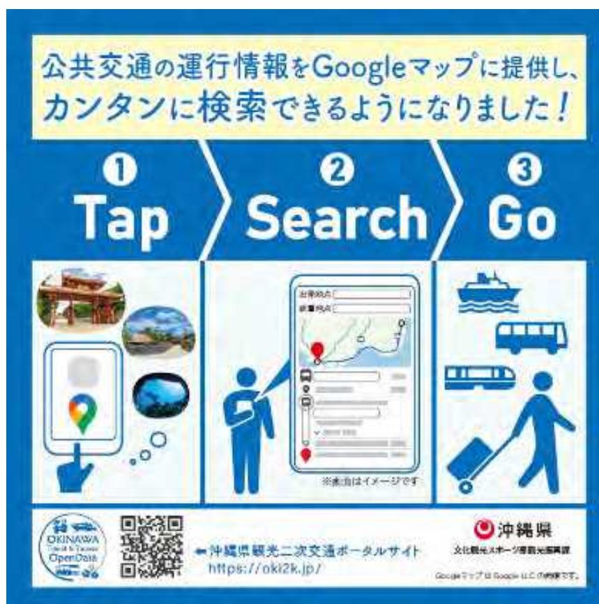
図表 61 配布した周知シール