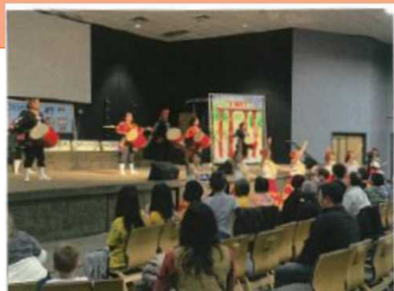
本番当日のイベントの様子

海外県人会に芸能指導者を派遣し、芸能指導及び世界のウチナンチュの日関連イベントの開催を支援