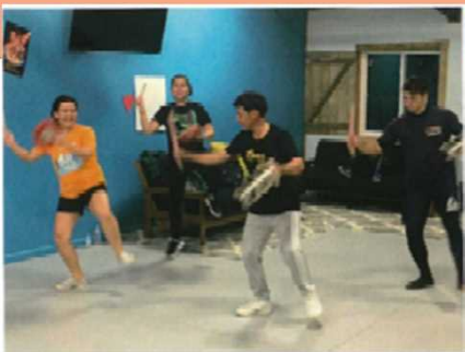
諸見里青年会によるエイサー指導の様子

(JICA沖縄と連携し、連携協定に基づき、水道、環境、地域保健医療、IT、水産、土木建築等の各分野において、海外からの研修員受入や途上国への技術協力を実施)