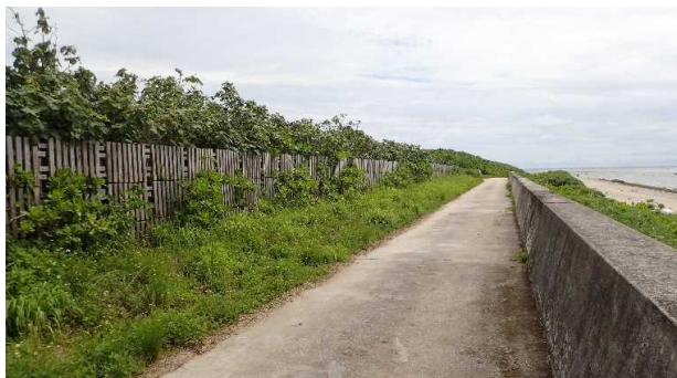
保安林緊急改良(H30白保)