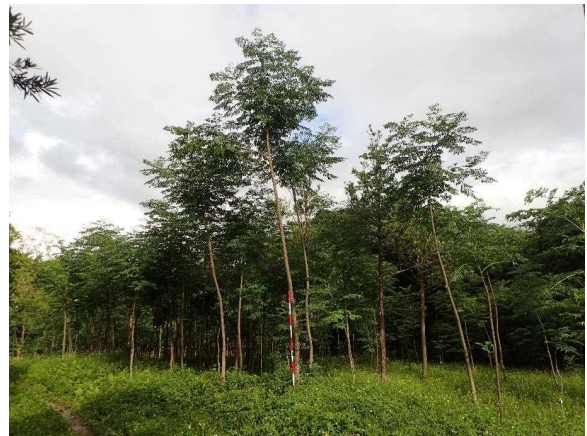
人工造林(センダン)