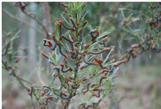
キオビエダシャク(平得大俣県営林)