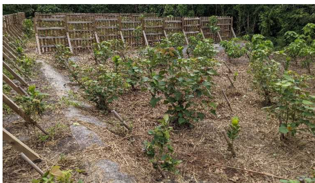
海岸防災林造成(R2真栄里)