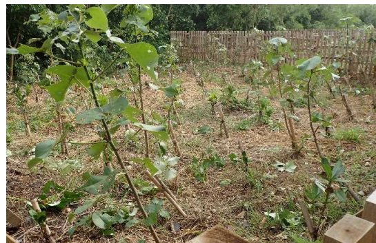
海岸防災林造成(R1真栄里)