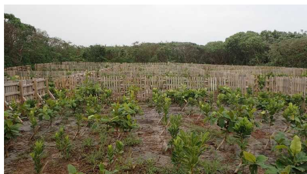
海岸防災林造成(R3白保)