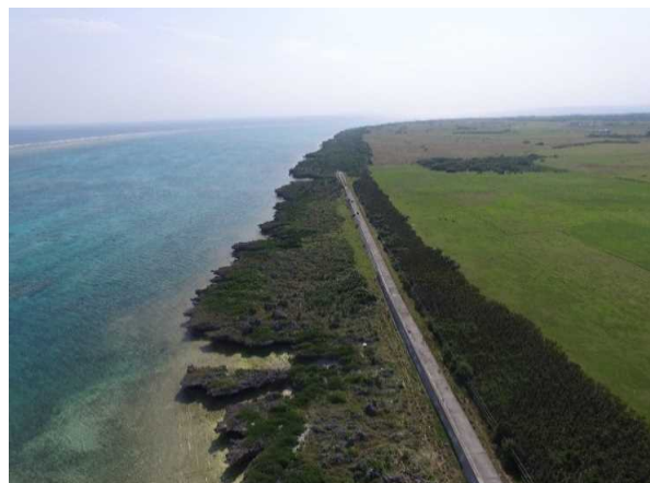
潮害防備保安林(竹富町黒島)