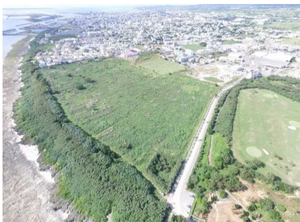
潮害防備保安林(石垣市真栄里)