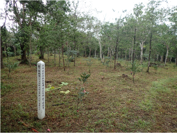
樹下植栽（上層:イヌマキ、下層 リュウキュウコクタン）