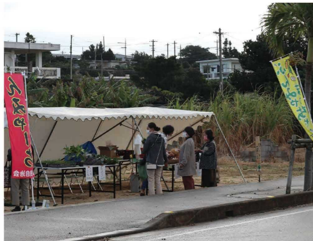
保良自治会(日曜市の開催、拝所の清掃・美化活動)