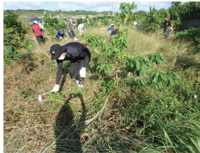
美ぎ島宮古グリーンネット(草刈り、植栽、育林活動)