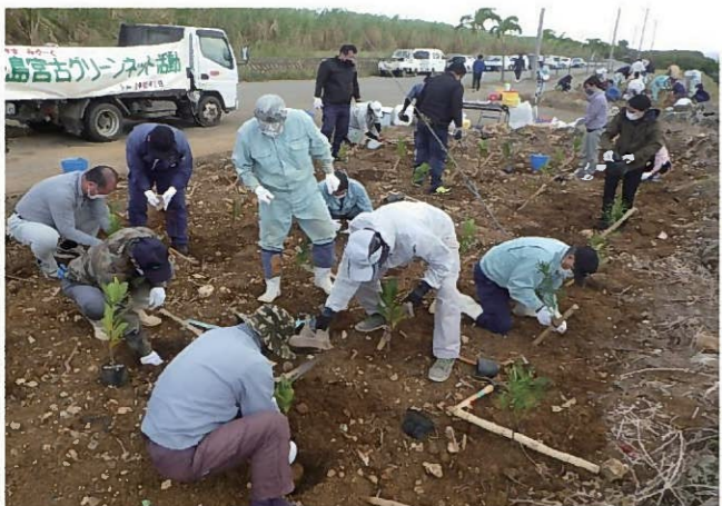
美ぎ島宮古グリーンネット(植栽、育林活動)