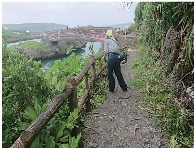
インギヤ遊歩道清掃作業