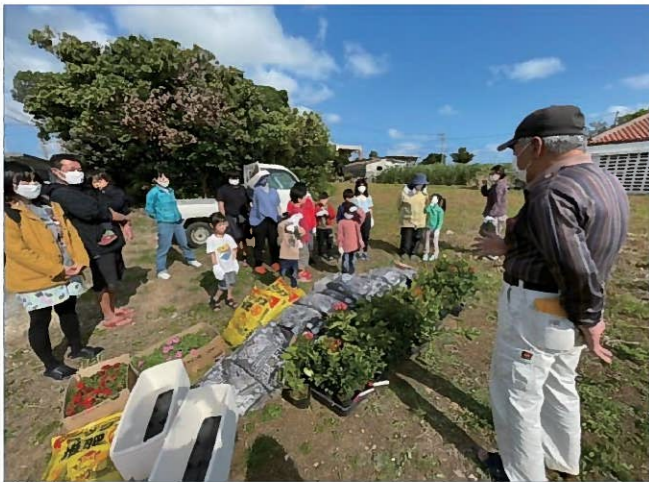
子供会による花苗・苗木の植栽