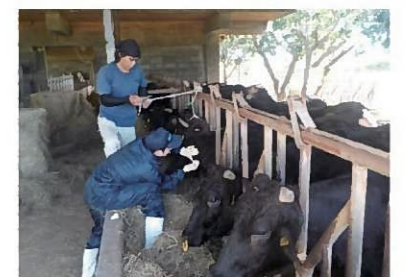
アカバネ病予防注射