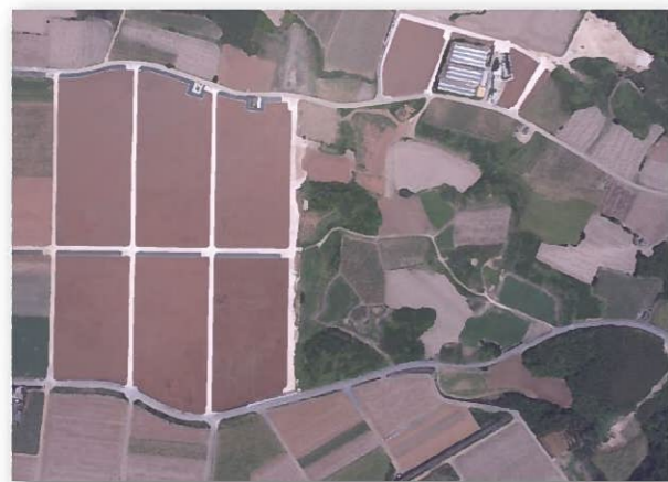
区画整理による整備箇所と未整備箇所の比較