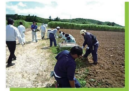
土壌保全の日 植栽の様子②