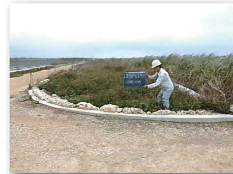
農地保全整備事業（防風施設施行前）