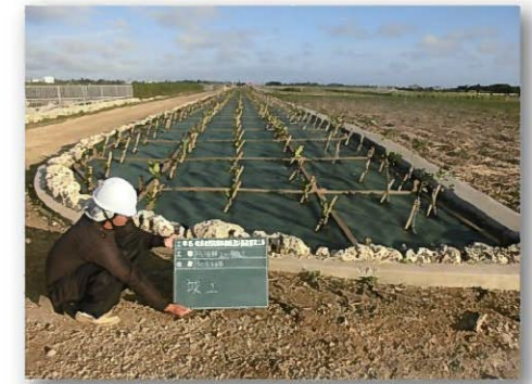
農地保全整備事業（防風施設施行後）