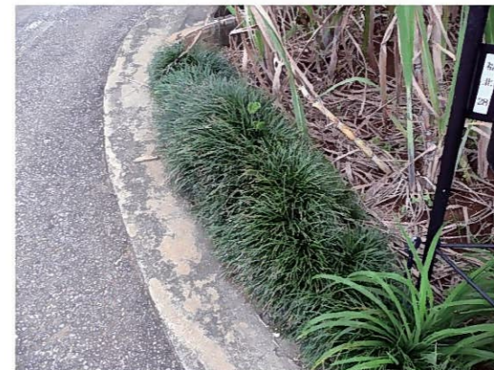
グリーンベルトの設置