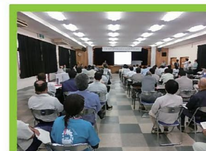
防風林の日 講演会

台風をはじめとした自然災害から農作物、農地を守る防風林・防潮林の普及啓発のため毎年11月の第4木曜日を「防風林の日」として定めています。防風林の日には、防風林として植樹された樹木の手入れや防風林の成長を妨げる下草の刈り取りが行われています。