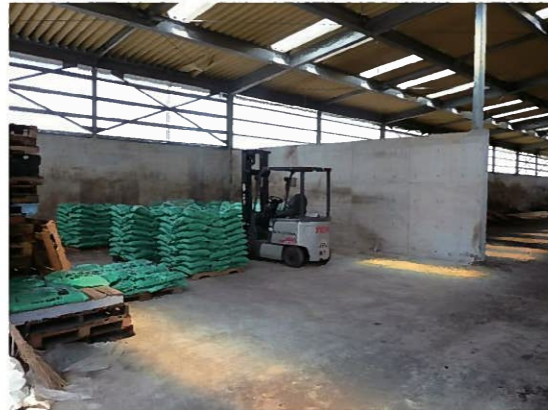
資源リサイクルセンター