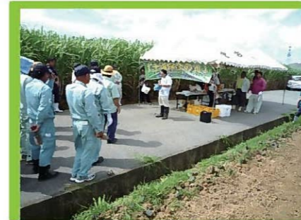
土壌保全の日 開会式の様子①

毎年6月の第1水曜日を土壌保全の日とし、土壌の流出による地力の低下を未然に防ぐことを目的に、土壌保全の必要性について意識の改善と啓発を目的として1990年から施行されました。宮古地域では、グリーンベルトの植栽活動を通して、土壌流出防止と農地の景観形成を目指し、リュウノヒゲやアキノワスレグサ等の植栽活動を行っています。