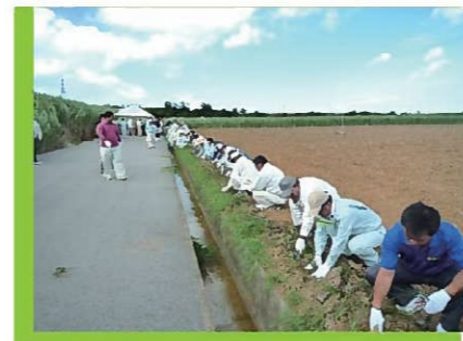
土壌保全の日 植栽の様子①