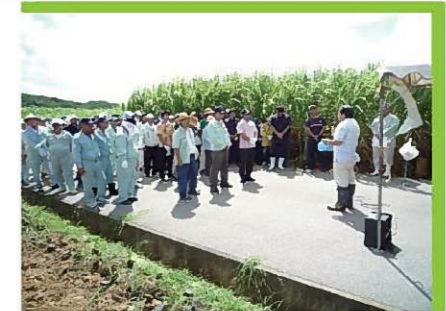
土壌保全の日 開会式の様子②