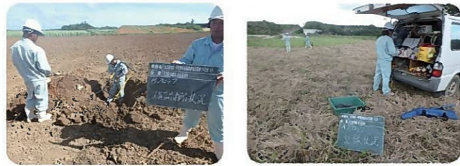
不発弾探査の様子