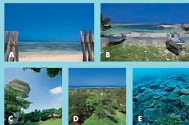
A. 白砂の美しいウブドマリ トゥブリ [B-1] B. 前泊港 [C-1] C. 八重山遠見台 [B-1] D. 八重山遠見台から見る水納島方面 [B-1] E. 多良間島北西部の沖合い