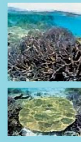
水納島南西部の沖合い