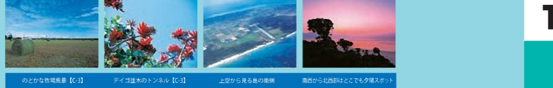
のどかな牧場風景 [C-3] デイコ並木のトンネル [C-3] 上空から見る島の南側 南西から北西部はどこでも夕陽スポット