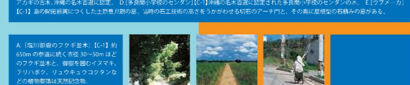
A. [塩川御嶽のフクギ並木] [C-1] 約650mの歩道に続く直径30~50mほどのフクギ並木、御嶽を囲むイヌマキ、テリハボク、リュウキュウコクランなどの植物群は天然記念物。 B. [サトウキビ畑の風景] [D-2] 島の東側に広がるサトウキビ畑の風景。 C. [普天間港] [C-2] D. E. [三ツ瀬公園入口の橋とビーチ] [C-2]