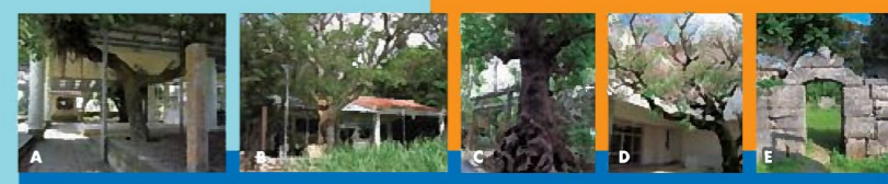
A. ヒトマタウガム [C-1] 島の八月餅を行う聖域。中央に土庫ウガムと同じく舞台があり、中央には高さ約1.5mのフクギ2本と数本のガジュマル、デイコが茂る。 B. 土庫ウガム [B-1] 島の八月餅を行う聖域。史跡土庫ウガム。遺跡の南側には枝張り約21mのアカギヤフキ、デイコ、ガジュマルなどの古木が繁茂し天然記念物として景指定の文化財。 C. 鐘巻の神木としてそびえ立つ樹高13m、幹周3.8mのアカギの古木。沖繩の名木百選に認定。 D. 多良間小学校のセンダン[C-1] 沖繩の名木百選に認定された多良間小学校のセンダンの木。 E. [フクギ] [C-1] 島の歴史を伝える石垣の意匠。当時の石工技術の高さをうかがわせる切石のアーチ門と、その奥に屋根型の石積みがある。