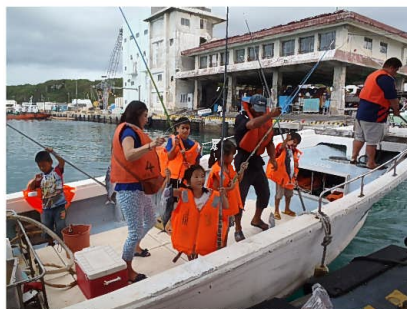
パヤオの日 鯨の一本釣り