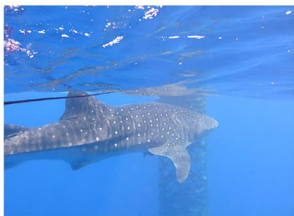
県設置パヤオ(海宝)に近づくジンベイザメ