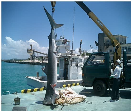
池間漁港 サメ水揚げ