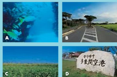
A. 多良間島南西部沖合いのオスメタイピングスポット B. 空港から島の中央部へ多良間空港橋 [A-2] C. サトウキビ畑の地中横切 [B-2] D. 多良間空港入口 [A-2]