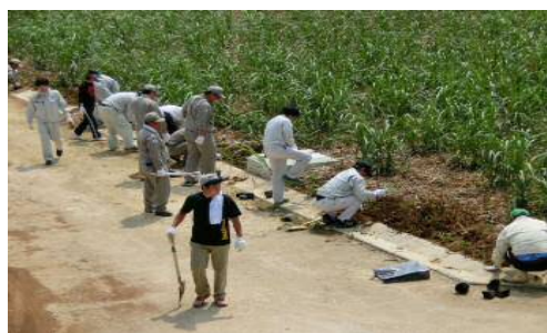
土壤保全の日 アキノワスレグサの植栽