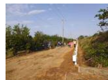
景観形成(空缶拾い)