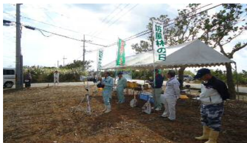
防風林の日 開会式①

台風をはじめとした自然災害から農作物、農地を守る防風林・防潮林の普及啓発のため毎年11月の第4木曜日を「防風林の日」として定めています。防風林の日には、防風林として植樹された樹木の手入れや防風林の成長を妨げる下草の刈り取りが行われています。