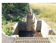
集水柵の蓋設置前