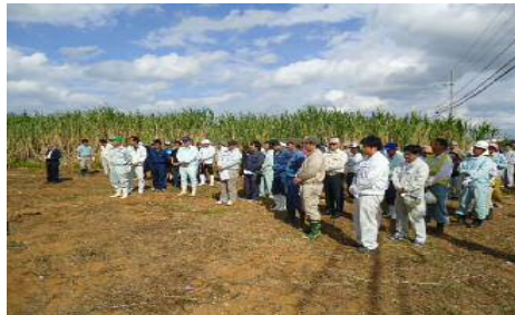
防風林の日 開会式②