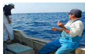
池間の石巻落とし