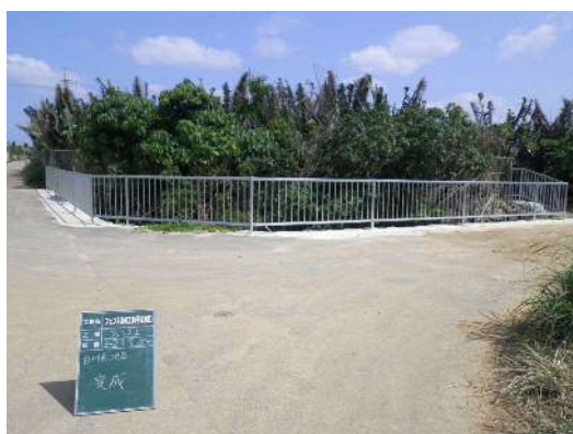
水利用調整・高度化支援事業による改修後のフェンス