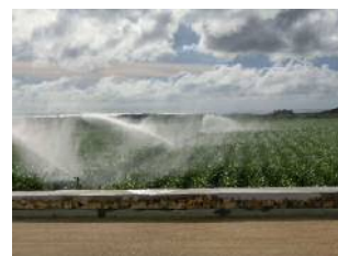
畑かん施設整備後(スプリンクラー)