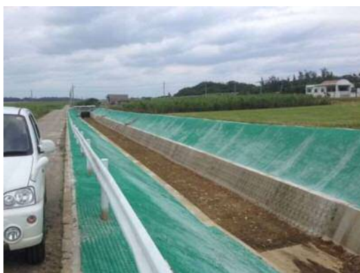
水利用調整・高度化支援事業による改修後の法面保護