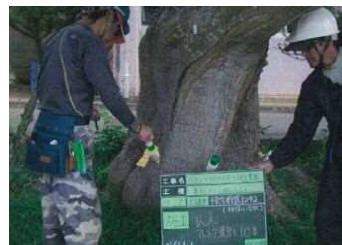
森林病虫害等防除事業