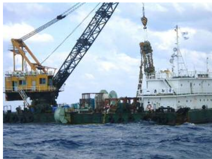
浮魚礁(パヤオ)回収状況