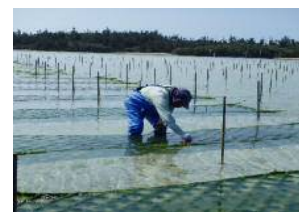
大浦湾のアーサ養殖