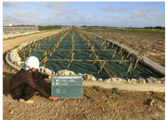
農地保全整備事業（防風施設施行後）