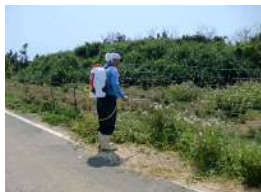
農道の維持・管理作業