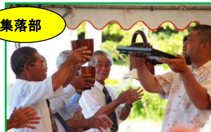
多良間村(長瀬川宗根、札屋宗根、南宗根、新池宗根)