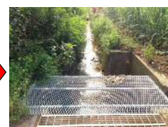
集水柵の蓋設置後