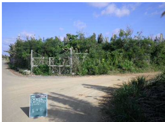
水利用調整・高度化支援事業による改修前のフェンス