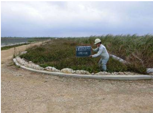
農地保全整備事業（防風施設施行前）