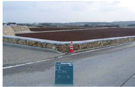
区画整理後のは場②