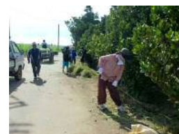
防風林帯の維持・管理作業