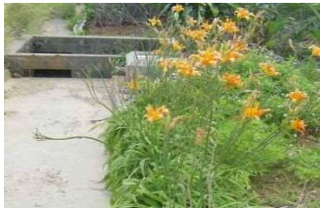
アキノワスレグサ