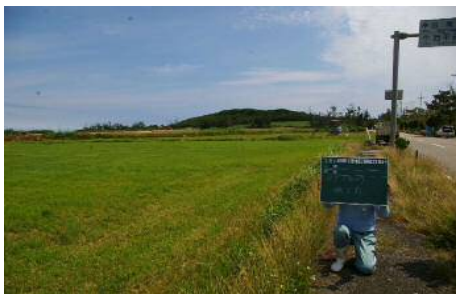
区画整理前のは場①