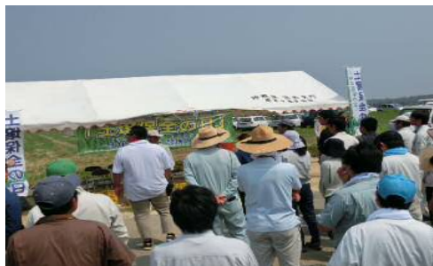
土壤保全の日 開会式の様子①

毎年6月の第1水曜日を土壤保全の日とし、土壤の流出による地力の低下を未然に防ぐことを目的に、土壤保全の必要性について意識の改善と啓発を目的として1990年から施行されました。宮古地域では、グリーンベルトの植栽活動を通して、土壤流出防止と農地の景観形成を目指し、リュウノヒゲやアキノワスレグサ等の植栽活動を行っています。