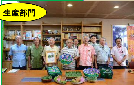
JAおきなわ宮古地区野菜・果樹生産出荷連絡協議会オクラ専門部会