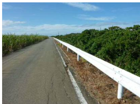
水利用調整・高度化支援事業による改修前の法面保護