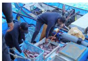
佐良浜のアギヤー漁