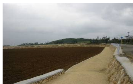
区画整理後のは場①