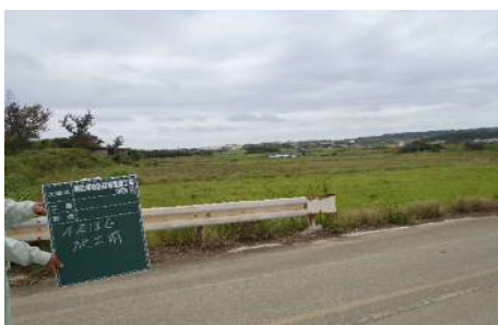
区画整理前のは場②