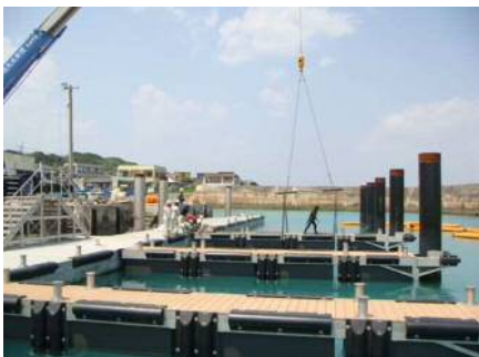
浮棧橋設置状況(佐良浜漁港)