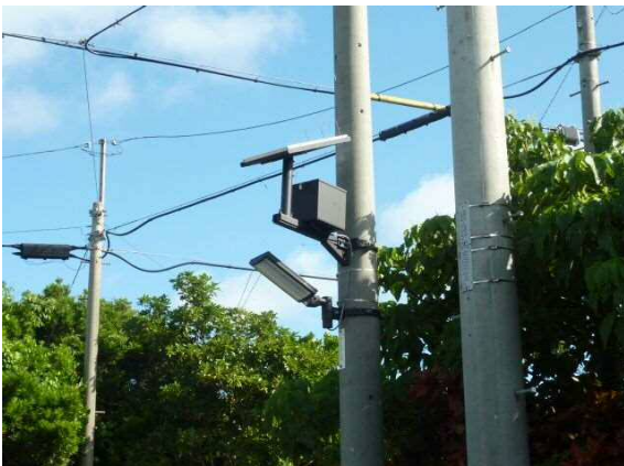
防災施設整備ソーラー照明(西東・吉田・仲原・久松)