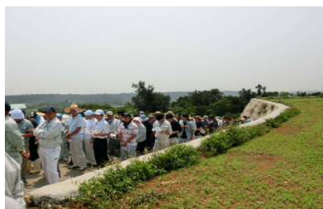
土壤保全の日 開会式の様子②