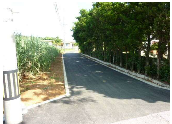
農業集落道整備(吉田)