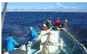
佐良浜のカツオー一本釣り