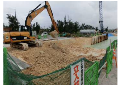
岸壁改良施工状況(荷川取漁港)