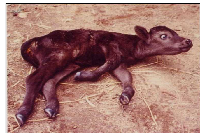
神経症状(眼球振とう)、 起立不能を示す子牛