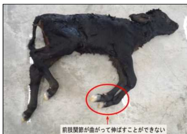
四肢の湾曲を示す 流産胎子