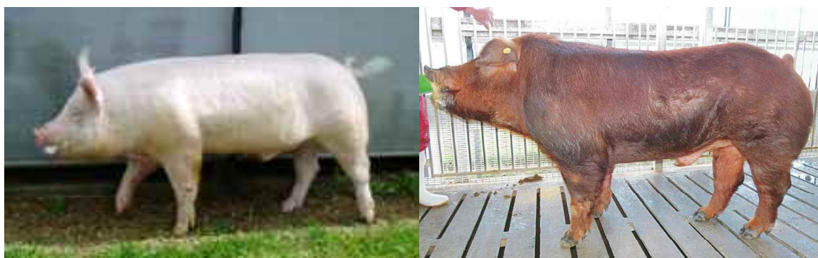
優良純粋種豚（大ヨークシャー種、デュロック種）