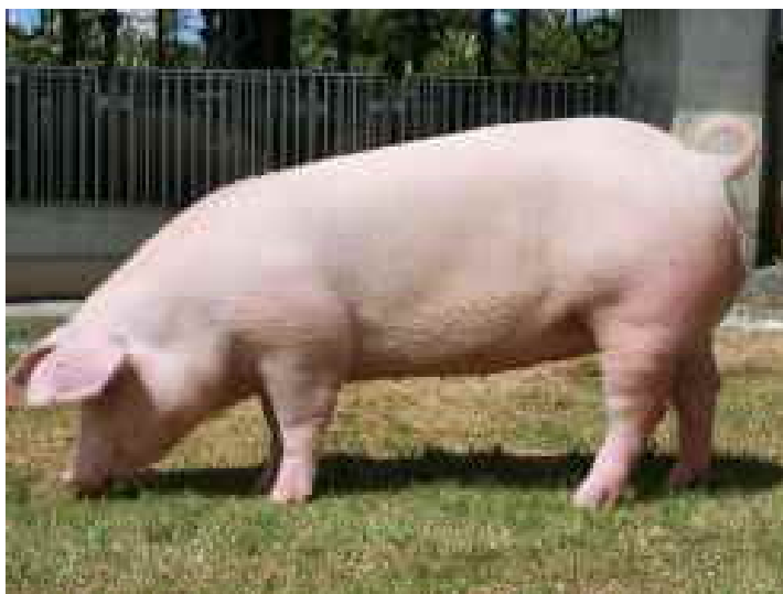
沖縄初の系統造成豚ランドレース種「オキナワアイランド」

家畜改良センターにおいて、種豚改良を推進し、優良種豚及び精液を養豚農家へ供給している。系統造成部門では、高度な統計育種技術を用い、ランドレース種の繁殖性・産肉性・強健性等の形質について改良を図り、能力・斉性が高い系統造成豚の作出を行っている。増殖部門では、県外の優良な純粋種豚（大ヨークシャー種、デュロック種）を導入し、計画交配・選抜を行い、優良種豚の作出を行っている。