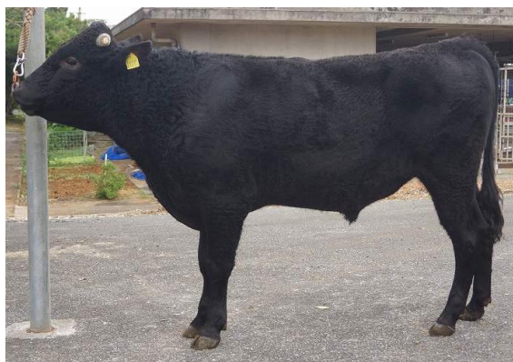
なつのりか 夏紀香 (夏百合×幸紀雄×安福久)