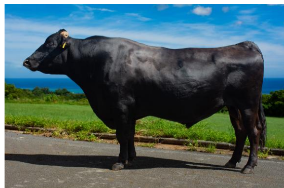
ちゅらゆり 美百合 百合白清2 ×美国桜×勝忠平