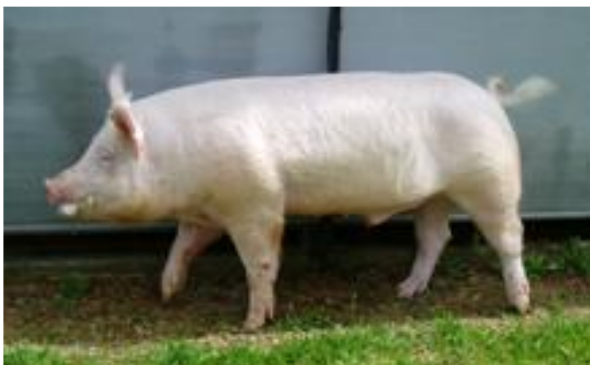
大ヨークシャー種