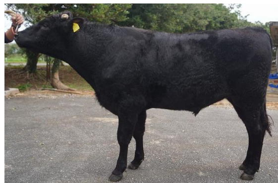
さなひら 紗奈平 (美津忠平×幸紀雄×美国桜)