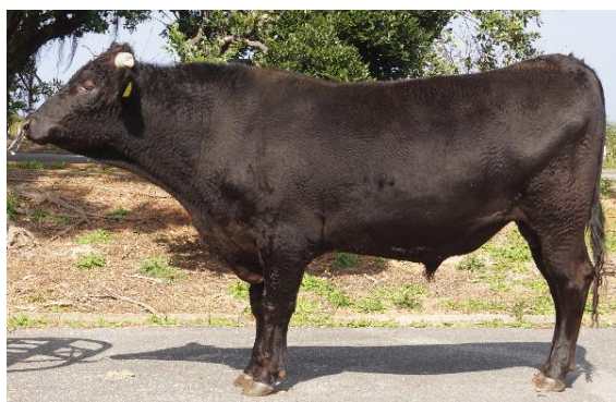
みやのほな 宮之華 (美津忠平×北福波×勝忠平)