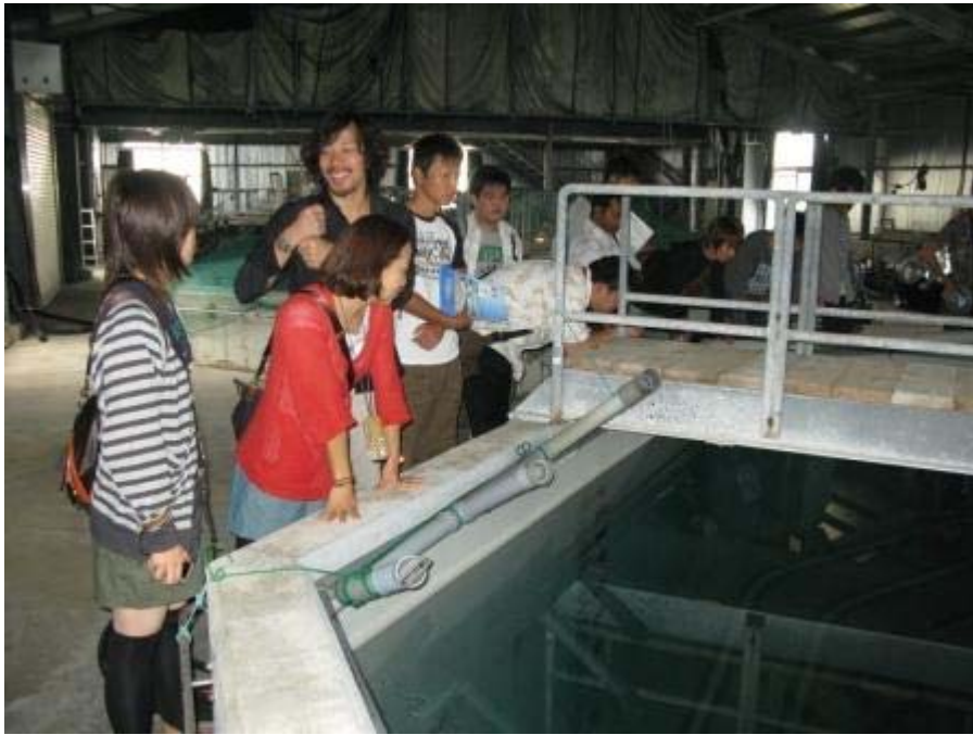
ヤイトハタの親魚水槽で。 「ホルモン処理せずに、自然採卵している。」という話に感心された教官もおられました。