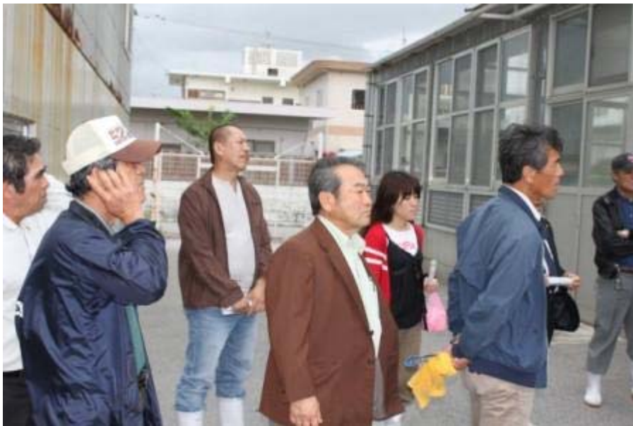
次は介類種苗生産施設へ移動。 「広いなあ！」 ちょっと疲れ気味か？