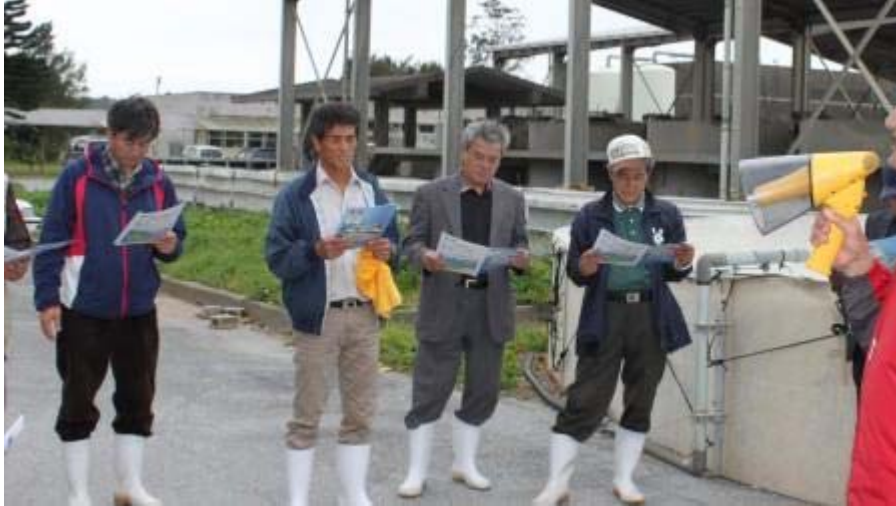
施設の概要説明を受ける議員の皆さん