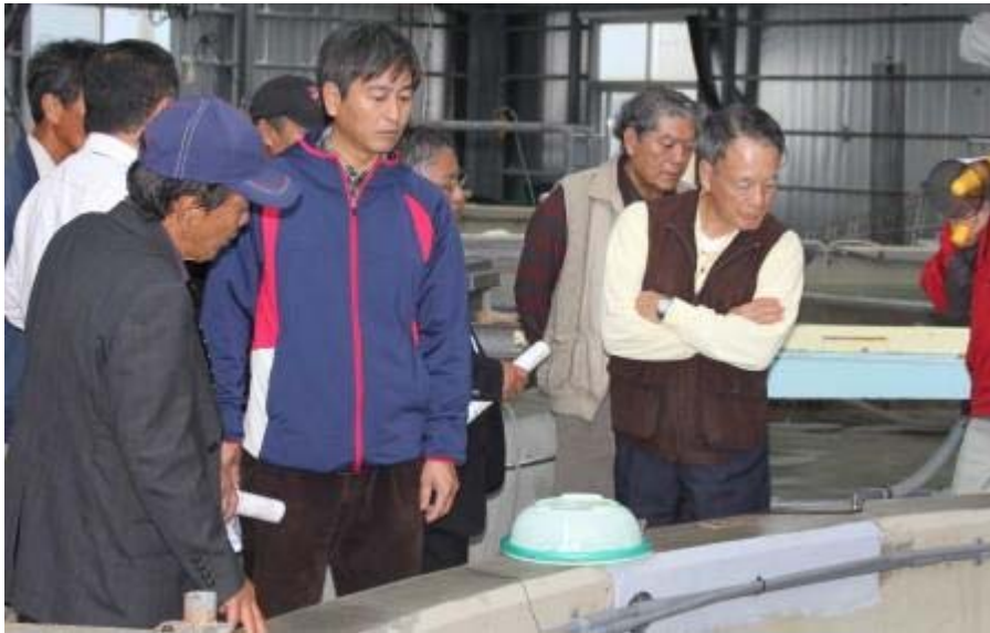
陸上水槽で中間育成中のマダイ種苗を見学。