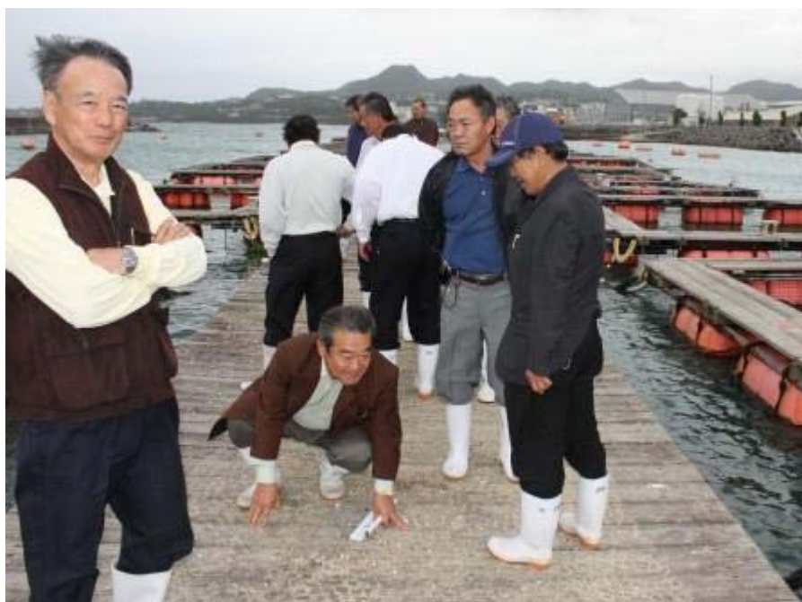
風が強く、生簀通路が揺れるので思わず、座り込む方のおられました。