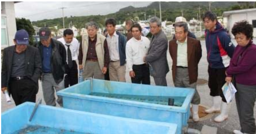
ヒメジャコの稚貝(十数mm)に「小さいなあ！」