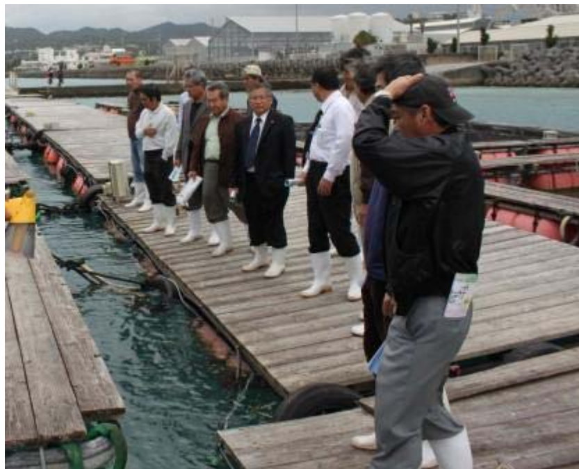
海面生簀で説明を受ける。