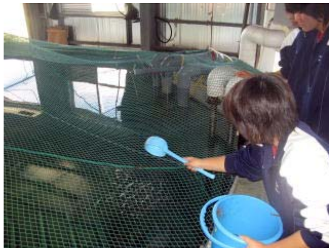
マダイの親魚が元気な卵を産めるように、栄養添加をした餌を与えています。