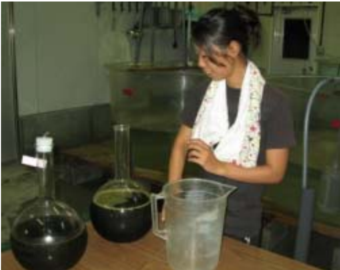
シラヒゲウニの餌の調整 キートセラス・グラシリス