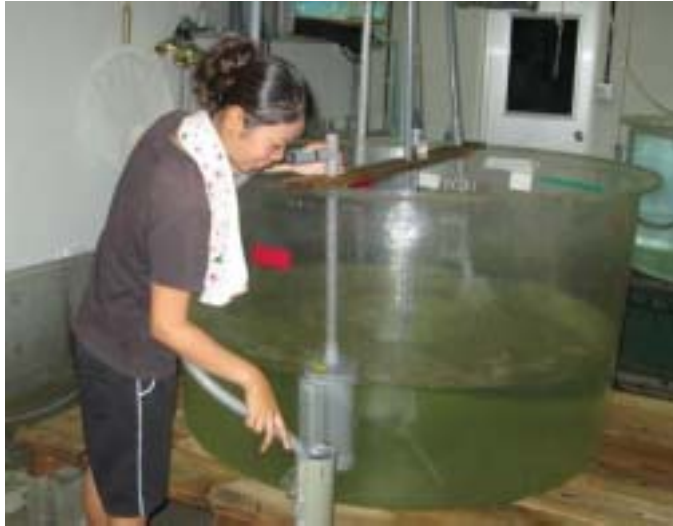
シラヒゲウニの幼生飼育水槽の管理 換水(水替え)作業をしています。