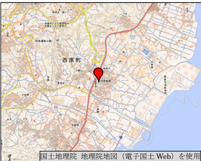
国土地理院 地理院地図（電子国土Web）を使用