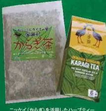
ニッケイ(からき)を活用したハーブティー

【参考資料】沖縄県 農林水産部 森林緑地課 『やんばる型森林業の推進～環境に配慮した森林利用の構築を目指して～ 施策方針(案)』平成25年3月 沖縄県 農林水産部 森林緑地課 『やんばる型森林業の推進～環境に配慮した森林利用の構築を目指して～』平成25年10月