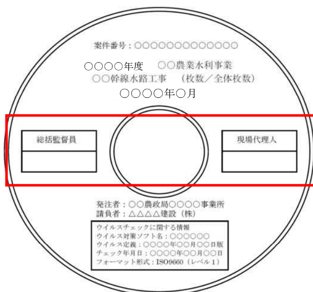
図 7-1 電子媒体への表記例