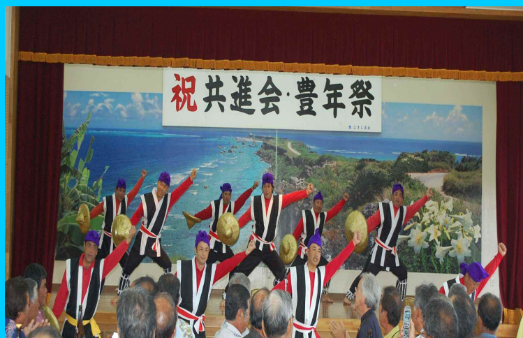
保良青年会が踊るヨンシー