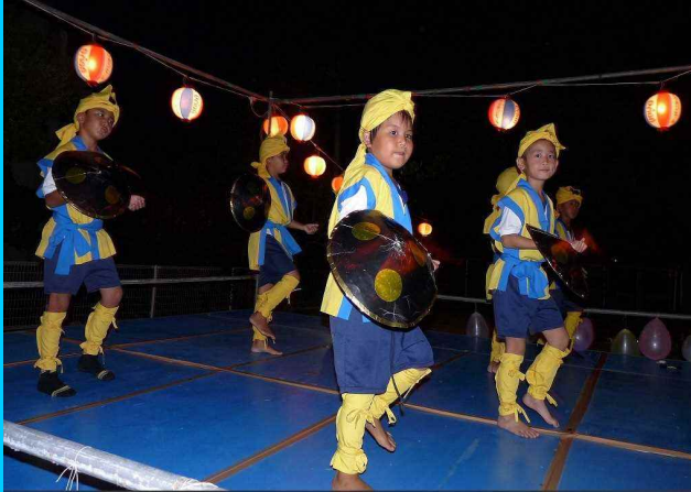
子ども会が踊るヨンシー