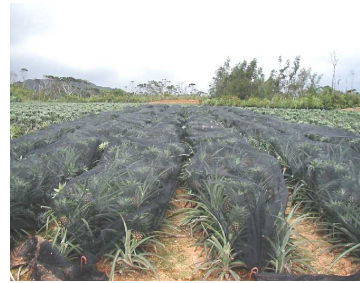
日焼け防止被覆ネット