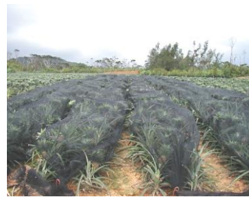
日焼け防止ネット