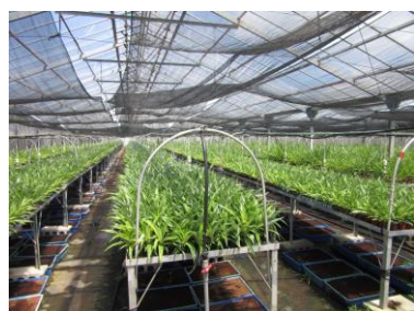
品質向上生産施設(種苗増殖施設)