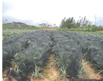
日焼け防止ネット