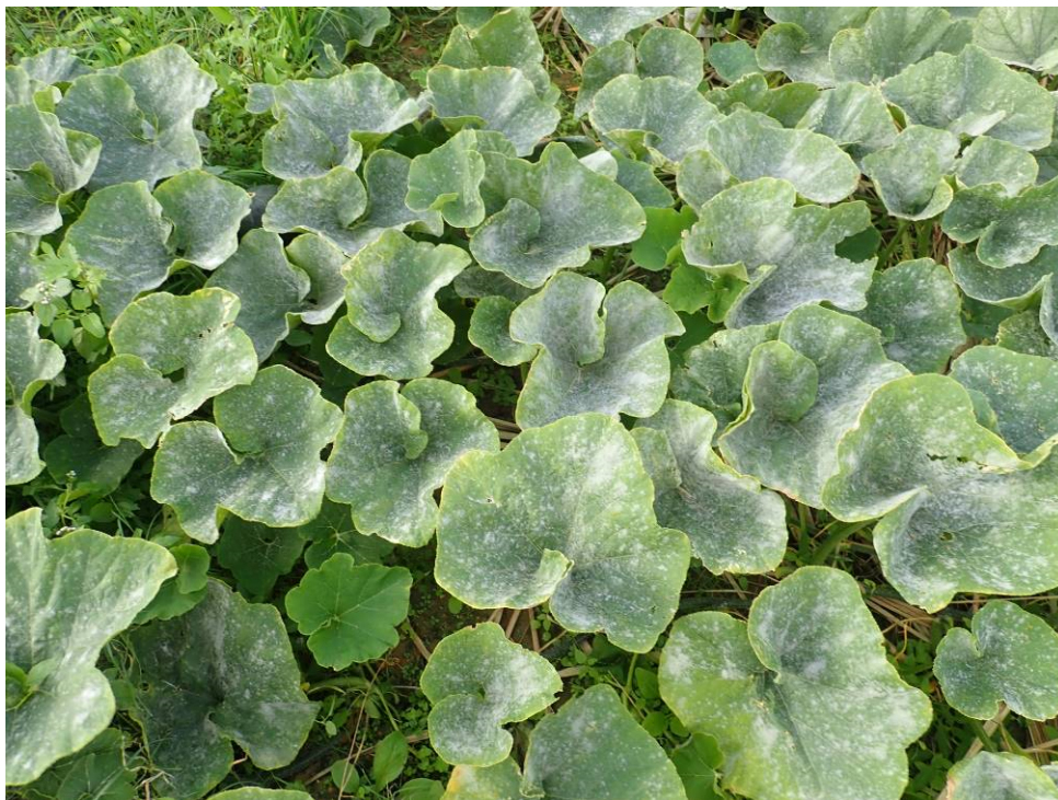
図4 多発生ほ場の様子