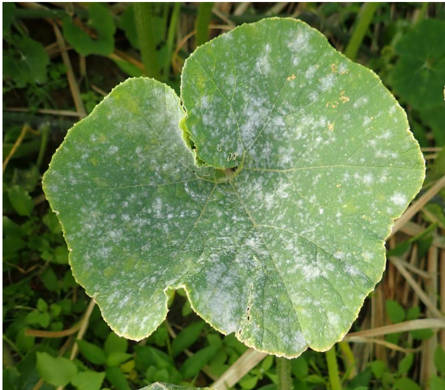
図3 葉における病徴