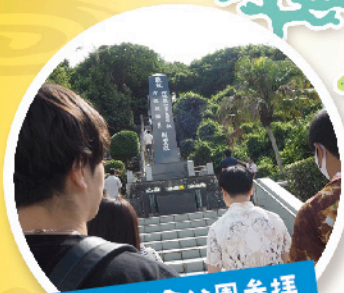
平和祈念公園参拝

過去の繋がりを現代の私たちが紡ぐ。 沖縄で出会って、共に学びの時間を共有し、 帰っても繋がりが続ける。 友愛の心で沖縄と兵庫を結ぶ旅。