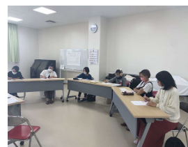
命のおはなし講座

本部小学校PTAママの会との共催で、講師を招いて講演会を行った。県内でも問題になっている若年出産、貧困の連鎖についてふれ、望まぬ妊娠を防ぐには幼いころからの命のはなし(性教育)が必要であることについて学んだ。