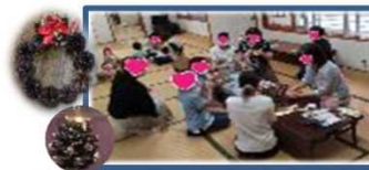
《お楽しみ講座》松ぼっくりオーナメント作り・段ボール工作・クリスマスクッキング