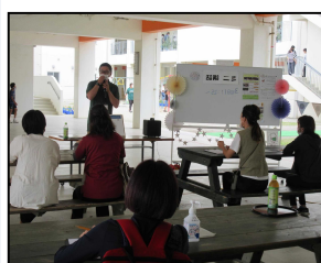
ミニ講話&ゆんたくスペース