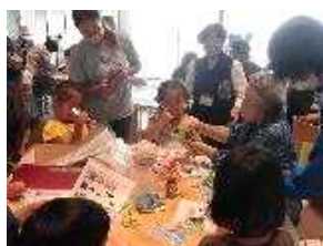
学び遊び体験広場