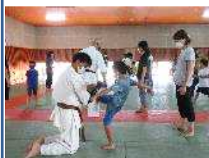
親子空手体験教室