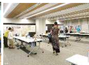
親子夏休み作品展