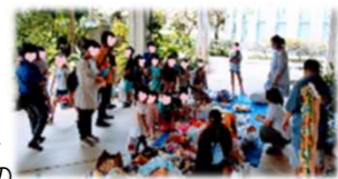
《夏のわくわく研究所》

子育ての基礎である家庭教育力の向上を支援するために、保護者のニーズを把握し関係機関と連携を図りながら、家庭教育学習の機会や情報交換・交流の場づくり等の事業展開をし、子育て世代の親子に寄り添う。