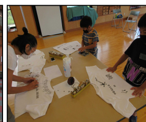
スタンプワークショップ