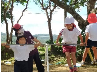
幼稚園児の体育授業参加