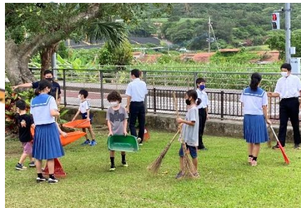
小・中学生による朝の清掃