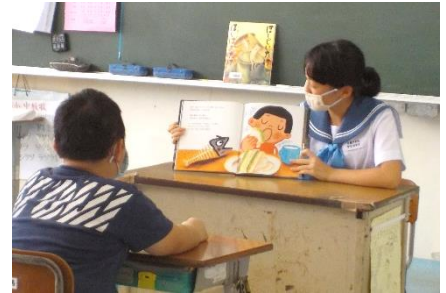
中学生による小学生への読み聞かせ