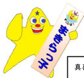
真喜良小マスコット 「キラりん」だよ♪

本校は新川小学校の過大規模校を解消し、規模の適正化を図るために分離新設された。石垣市で20番目の学校で、児童数287名（令和5年度現在）、学級数15学級の学校である。校舎建築は、近代建築の粋を集めて斬新な設計、建築技術で、地域の特性を生かして細心の配慮がなされた設計になっている。