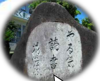
やる気・読書・花いっぱい