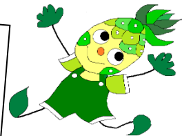
学校キャラクター