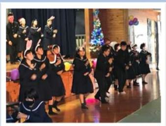
クリスマスライブ