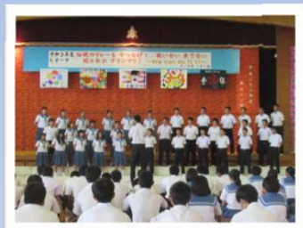
毎年恒例「合唱コンクール」