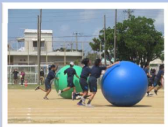
3年に一度の「体育祭」