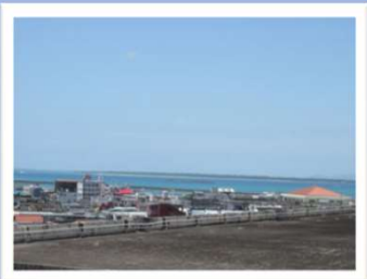
4階から見える青い海と竹富島