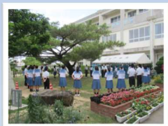
生徒会ミーティング