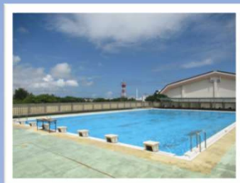
石垣で一番 空に近いプール