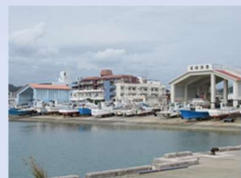
石垣漁港（通称：新川漁港）

本校「石垣市立石垣中学校」は、創立73年目を迎え、地域の人々や保護者の皆さんに支えられて、伝統と歴史をつないできた学校です。