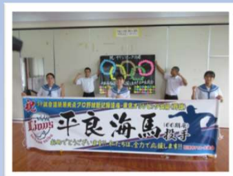
先輩の活躍を喜ぶ