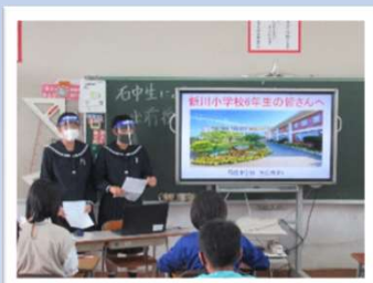
校区内小学校での石中紹介