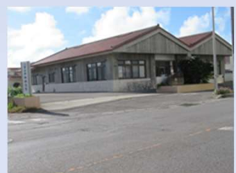
八重山平和祈念館