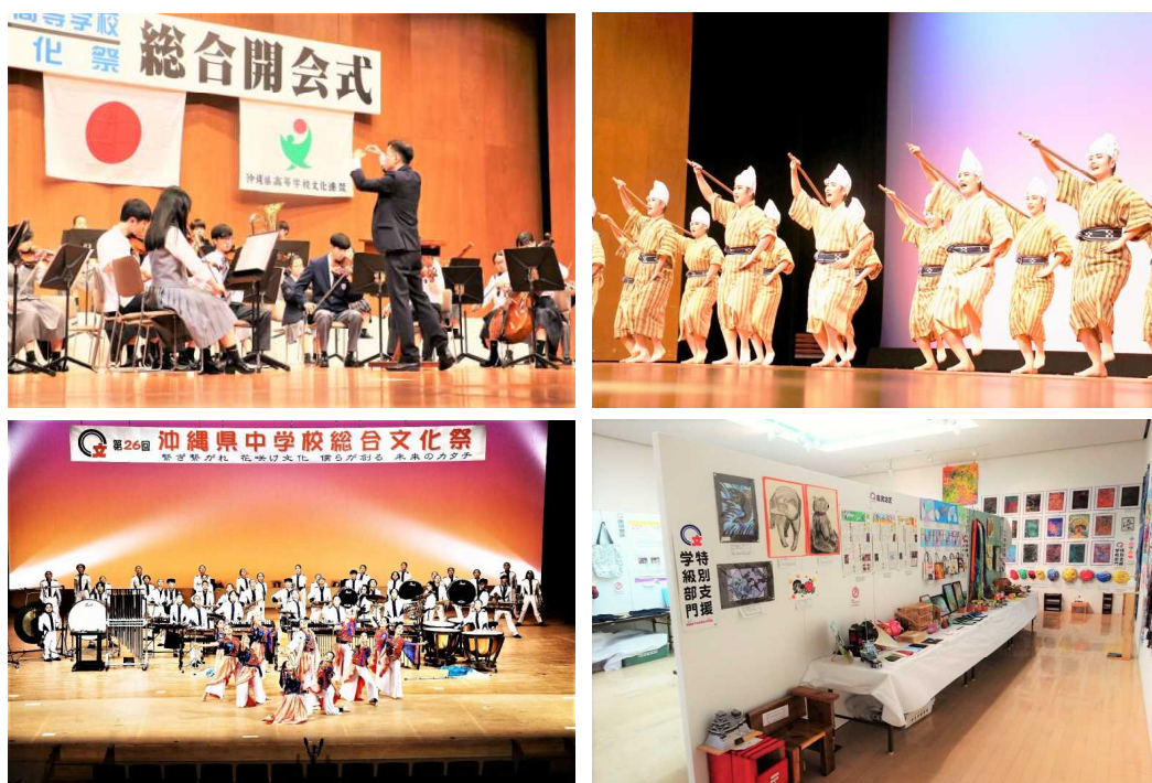
(上段) 沖縄県高等学校総合文化祭 (下段) 沖縄県中学校総合文化祭