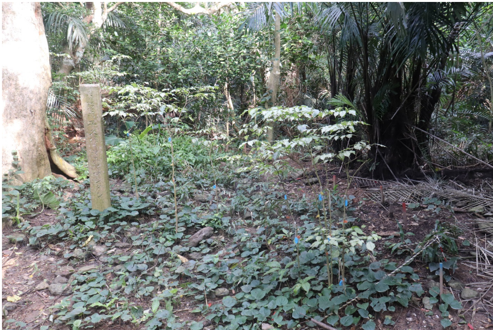
②幼木が集中している範囲