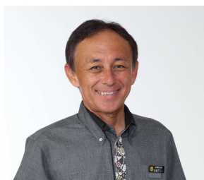
沖縄県知事 玉城デニー