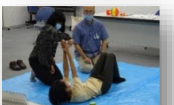
基本的な介護技術を学ぶ