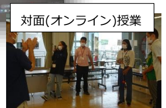
対面(オンライン)授業