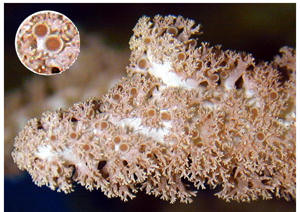
写真2. 刺胞球(刺胞球が見える。円内は拡大図)