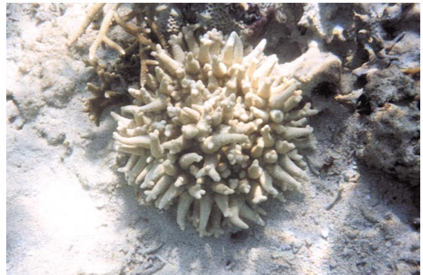
写真1. フサウンバチイソギンチャク(触手が隠れているときは、サンゴとの見分けがむづかしい)

これらの毒素をさらに詳しく調べることにより、両イソギンチャクに刺された時の新しい治療法が見つかるかもしれません。また、これらの刺胞の毒液中には今回紹介した毒素の他にも色々な成分が含まれていることがわかっています。他の成分については現在研究中ですので、近い将来、紹介できるものと思います。(衛生動物室)