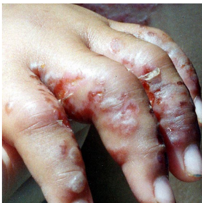
写真4. ウンバチイソギンチャクによる刺傷