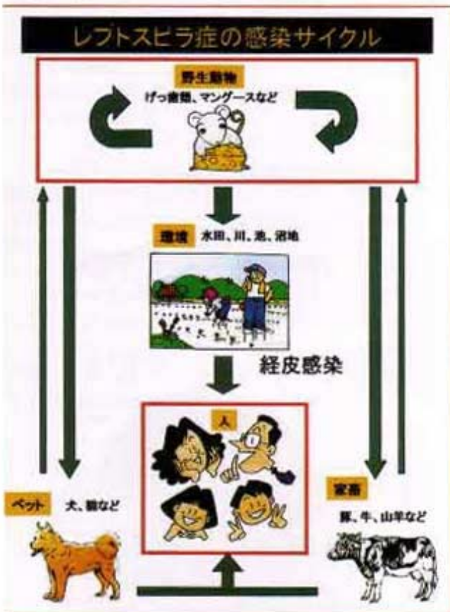
図1 レプトスピラ症の感染サイクル