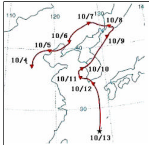
図1. 平成16年10月13日の「煙霧」発生時の大気の移流経路

場合も多くみられます。(後方流跡線解析には、NOAA HYSPLIT MODELを利用しました。) 【大気室】