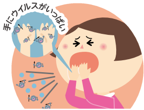
咳やくしゃみを手でおさえてしまったあと