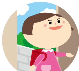
外から帰ったあと