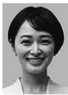
市井紗耶香 いちい さやか