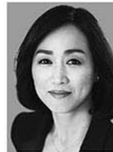
釈りょうこ しゃく

党女性局長を経て現職。2016年、国連女子差別撤廃委員会ですピーチを行う。夕刊紙連載ほか、著書に「繁栄の国づくり」など。