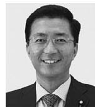
党副委員長 山下 よしき 現 59歳。参院議員3期。 活動地域 大阪、兵庫、滋賀、奈良、和歌山