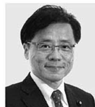
党参院幹事長・国対委員長 井上 さとし 現 61歳。参院議員3期。 活動地域 東海、北陸信越、京都