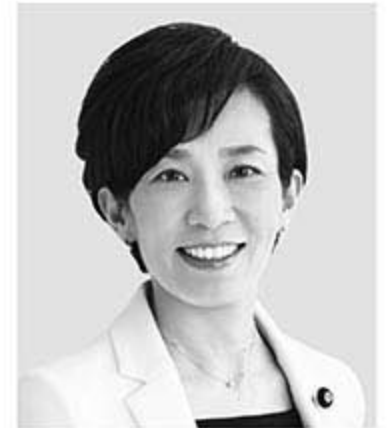
山本 かなえ 現 役職:元厚生労働副大臣。 参院議員3期。 経歴:京都大学文学部卒。 年齢:48歳 「あなたの声を、かなえるチカラ。」