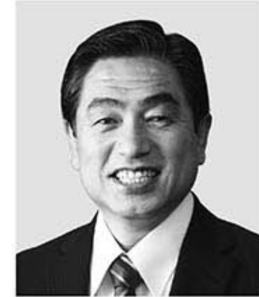
若松 かねしげ 現 役職:元復興副大臣。参院議員1期。 経歴:中央大学二部卒。公認会計士。 税理士。行政書士。 年齢:63歳 「現場第一」で復興・防災に全力