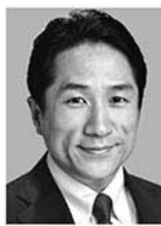
川田龍平 かわた りゅうへい