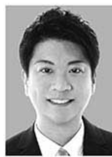
石川大我 いしかわ たいが