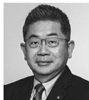
党書記局長 小池 晃 現 59歳。参院議員3期。全国革新懇代表世話人。医師。 活動地域 東京