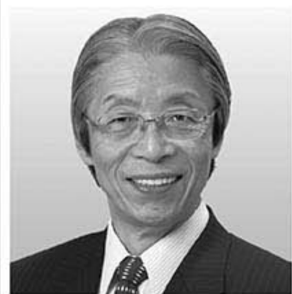
[党首] 又市 征治