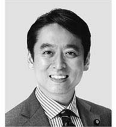
平木 だいさく 現 役職:元経済産業大臣政務官。 参院議員1期。 経歴:東京大学法学部卒。 年齢:44歳 未来をひらく 確かな実力!