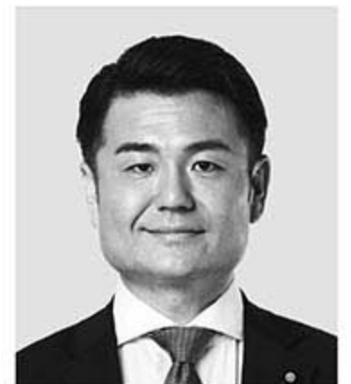
かわの 義博 現 役職:党食品ロス削減推進 プロジェクトチーム事務局長。 参院議員1期。 経歴:慶應義塾大学経済学部卒。 年齢:41歳 近い。速い。温かい。

公明党は、参院選比例区に上記の6人をはじめ17人を公認しています。(順不同) ※年齢は公示日現在