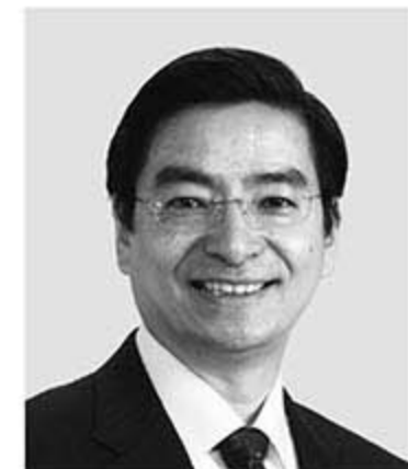
山本 ひろし 現 役職:元財務大臣政務官。 参院議員2期。 経歴:慶應義塾大学法学部卒。 年齢:64歳 現場直結で障がい者支援と地域復興