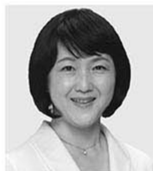
前衆院議員 梅村 さえこ 新 55歳。元消費税をなくす全国の会事務局長。 活動地域 埼玉、茨城、栃木、群馬