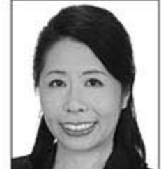
若林アキ 党女性局長 ジャーナリスト