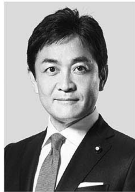
国民民主党 代表 玉木雄一郎