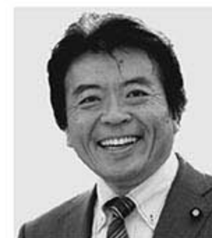
弁護士 仁比 そうへい 現 55歳。参院議員2期。党参院国対副委員長。 活動地域 中国、四国、九州・沖縄