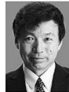
及川幸久 おいかわ ゆきひさ

ユーチューバー「及川幸久 潜在意識チャンネル」、作家、国際政治コメンテーター、幸福実現党外務局長。