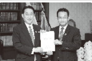
岸田総裁就任で早速沖縄の県民所得向上と沖縄振興開発金融公庫の存続を要請