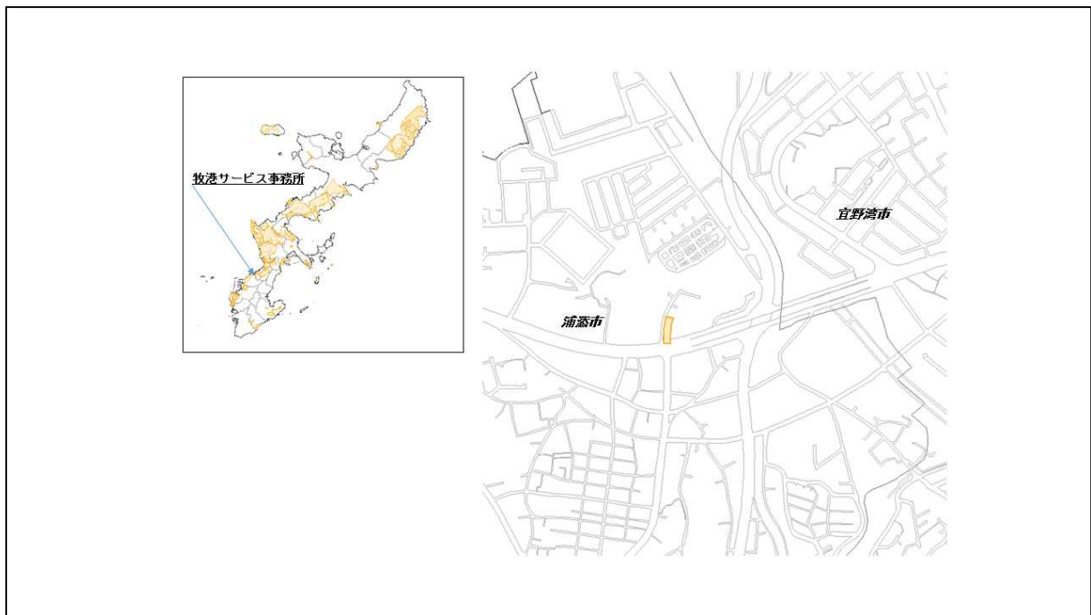
図 53-1 牧港サービス事務所の位置図（昭和 47 年時）

( http://www.mofa.go.jp/mofaj/area/usa/sfa/kyoutei/pdfs/02_03.pdf ) を参照