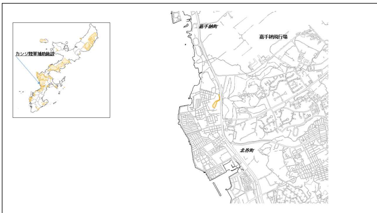
図 39-1 カシジ陸軍補助施設の位置図（昭和47年時）

( http://www.mofa.go.jp/mofaj/area/usa/sfa/kyoutei/pdfs/02_03.pdf ) を参照