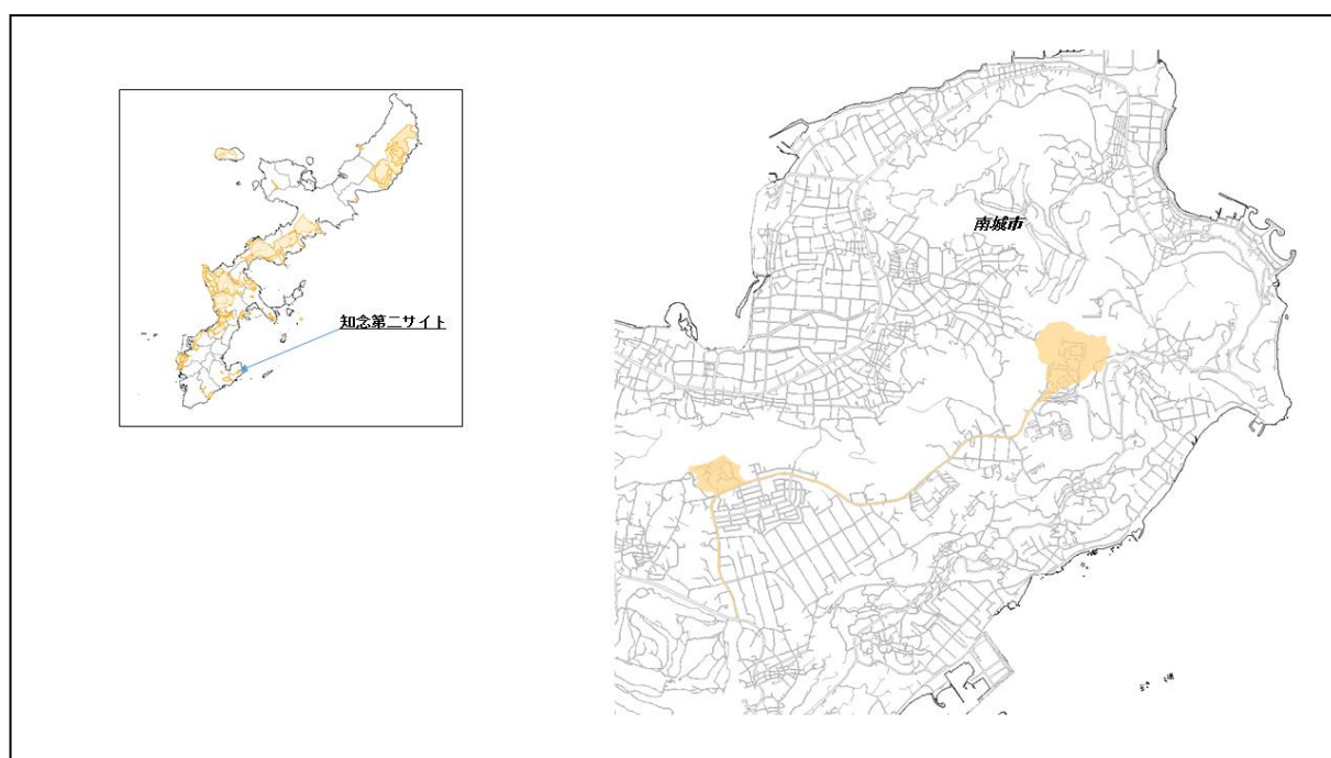
図 67-1 知念第二サイトの位置図（昭和47年時）

( http://www.mofa.go.jp/mofaj/area/usa/sfa/kyoutei/pdfs/02_03.pdf ) を参照