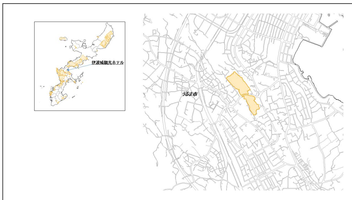
図 87-1 伊波城観光ホテルの位置図（昭和47年時）

( http://www.mofa.go.jp/mofaj/area/usa/sfa/kyoutei/pdfs/02_03.pdf ) を参照